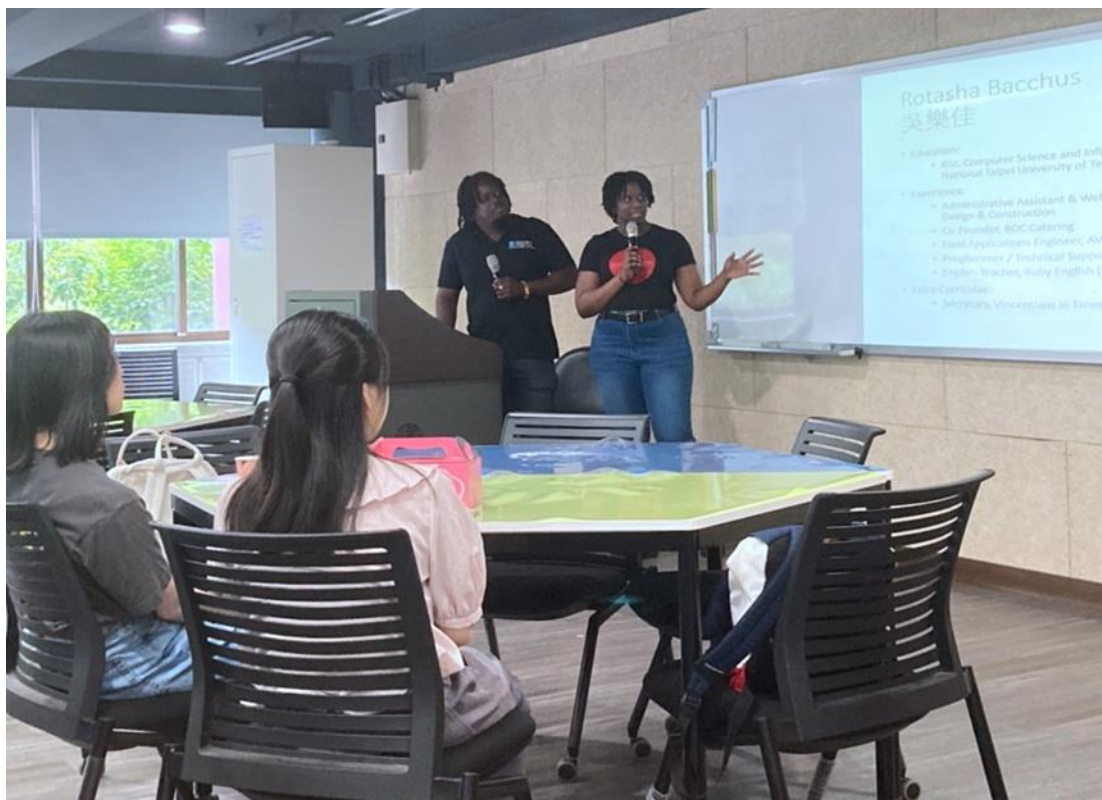
雙語角落推動跨文化交流

https://pr.ntnu.edu.tw/news/index.php?mode=data&id=21683&keywords=%E8%81%96%E6%96%87%E6%A3%AE 。