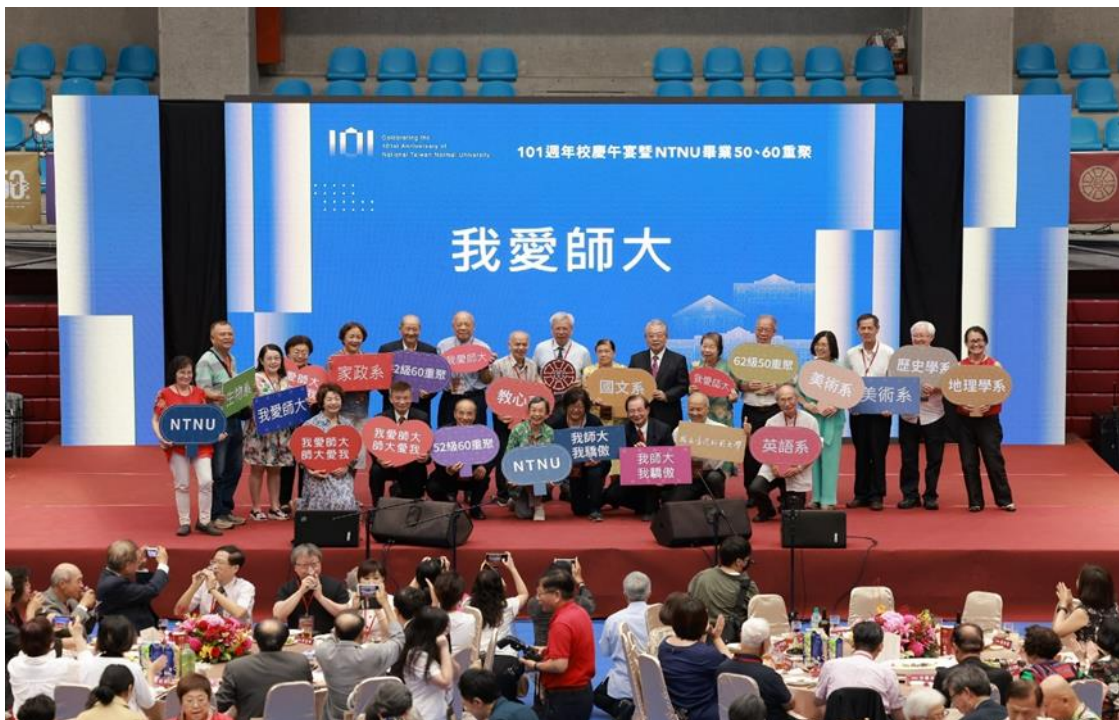
本校慶祝創校 101 週年，6 月 3 日首度舉行畢業 50、60 重聚活動

https://pr.ntnu.edu.tw/news/index.php?mode=data&id=21648 。