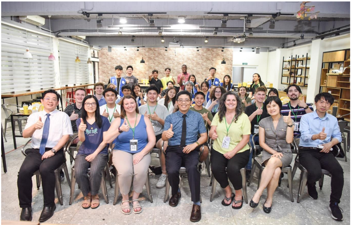
參與活動之師生大合照