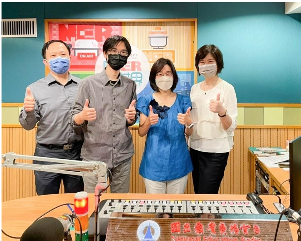
教育廣播電臺「大師心對話」參訪合影

https://pr.ntnu.edu.tw/news/index.php?mode=data&id=20802 。