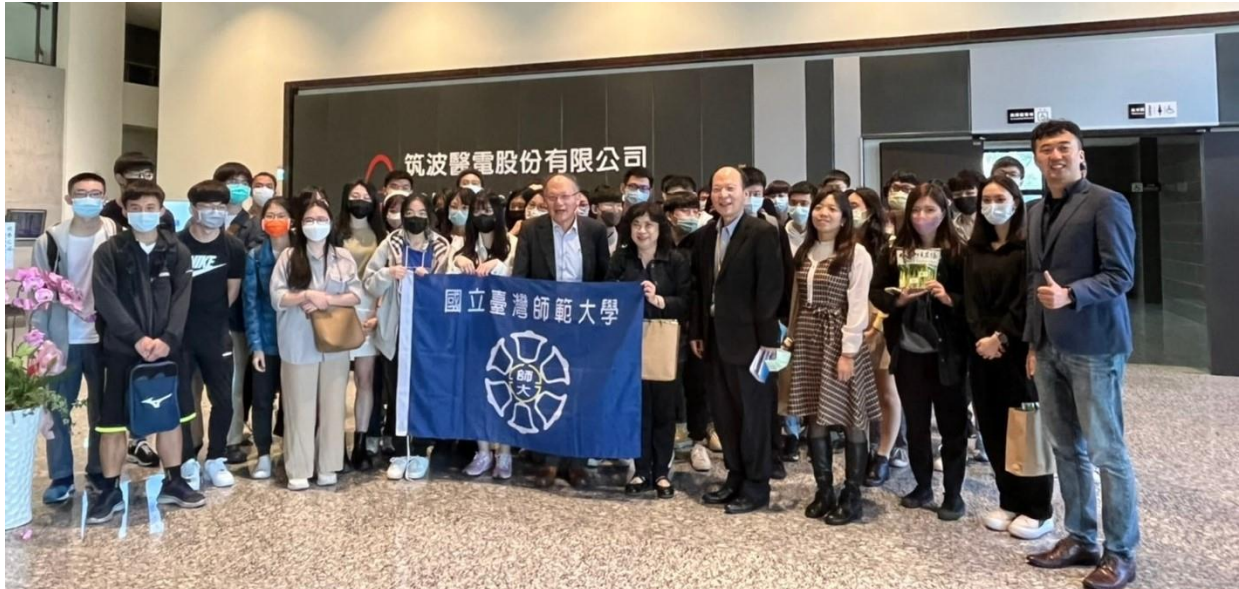
本校師生至筑波企業參訪合影