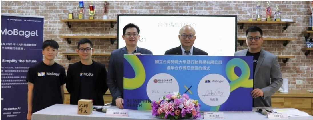
本院科技系與行動貝果有限公司簽署合作備忘錄合影

https://pr.ntnu.edu.tw/ntnunews/index.php?mode=data&id=20741 。